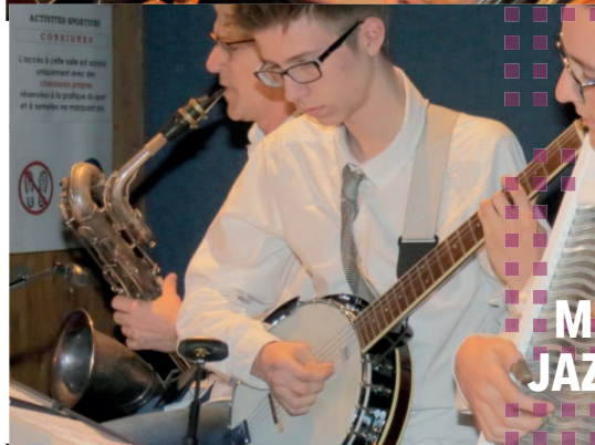
MIRECOURT JAZZ COMBO