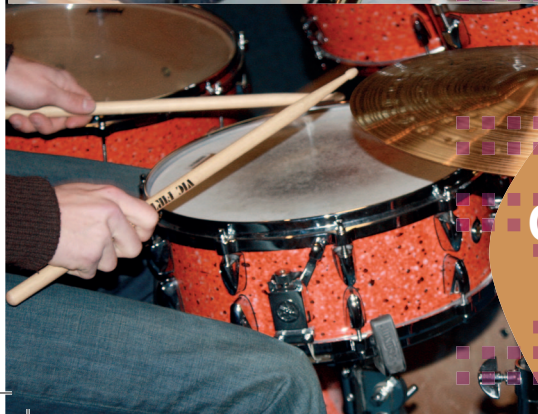
CLASSE DE BATTERIE