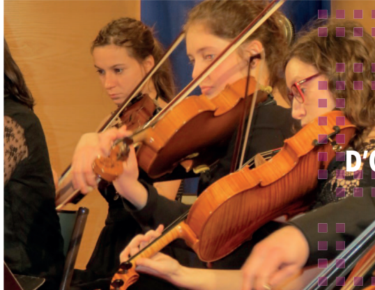
CLASSE D'ORCHESTRE CORDES