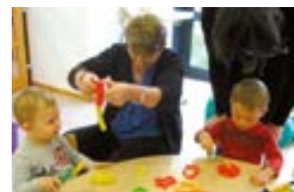
Atelier pâte à modeler