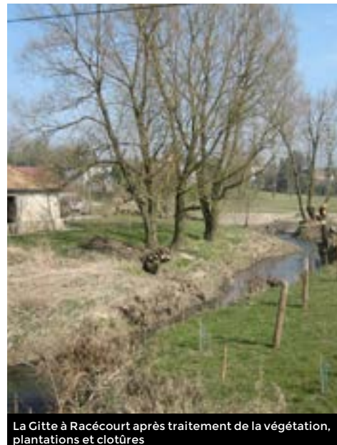
La Gitte à Racécourt après traitement de la végétation, plantations et clôtures

Le programme de restauration et de renaturation de la Gitte Aval débuté fin 2014 a trouvé son aboutissement en cette fin d'année. Sur la partie Aval de la Gitte, ainsi que trois de ses affluents, les actions se sont exercées sur une surface de 114 km 2 et un linéaire de cours d'eau de 19 kms sur les Communes de Racécourt, Velotte et Tatignécourt, Circourt, Derbamont, Vaubexy et Bazegney. Ce programme a permis de remettre en "bon état de fonctionnement" ces cours d'eau, c'est-à-dire rétablir une bonne capacité d'écoulement des eaux, tout en conservant et favorisant leurs caractéristiques et fonctions naturelles et paysagères. Les travaux ont été effectués par l'entreprise SW ENVIRONNEMENT pour un montant total de 227 000.00 € H.T sous la maîtrise d'œuvre de la Chambre d'Agriculture des Vosges. L'Agence de l'Eau Rhin Meuse et le Conseil Départemental des Vosges ont été les deux partenaires financiers de la Comcom avec des montants de subventions respectivement de 136 000.00 € et de 45 500.00 €.