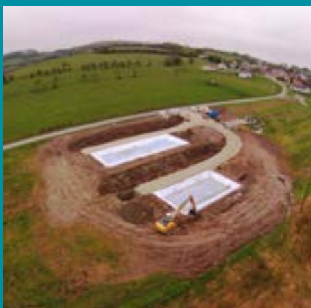
Construction de la station de Bettegney Saint Brice Vue drone

⚠ RAPPEL : il est interdit de jeter tout corps solide ou non (lingettes, rouleaux de papier toilette, tampons hygiéniques, y compris toutes les matières annoncées bio-dégradables)