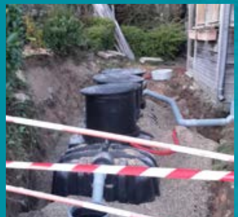
Réhabilitation d'un système d'assainissement non collectif