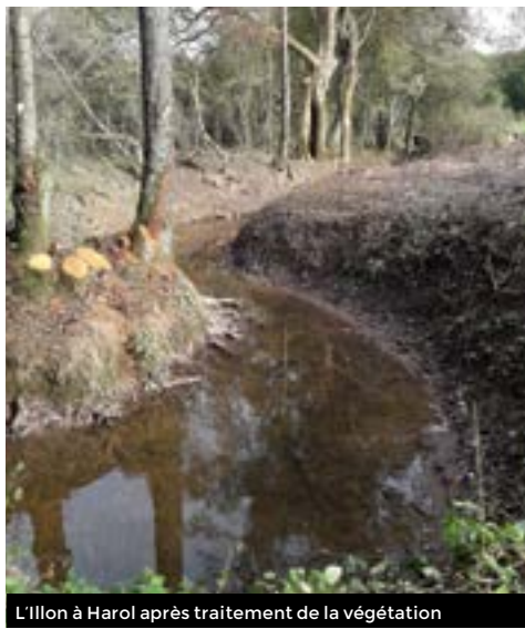
L'Illon à Harol après traitement de la végétation