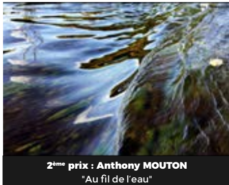
2 ème prix : Anthony MOUTON "Au fil de l'eau"