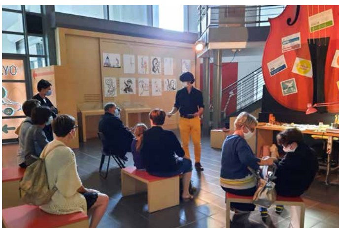
"Autour de l'établi", une des visites thématiques proposées par le musée de Mirecourt.