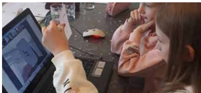
Chez soi, de l'autre côté du miroir