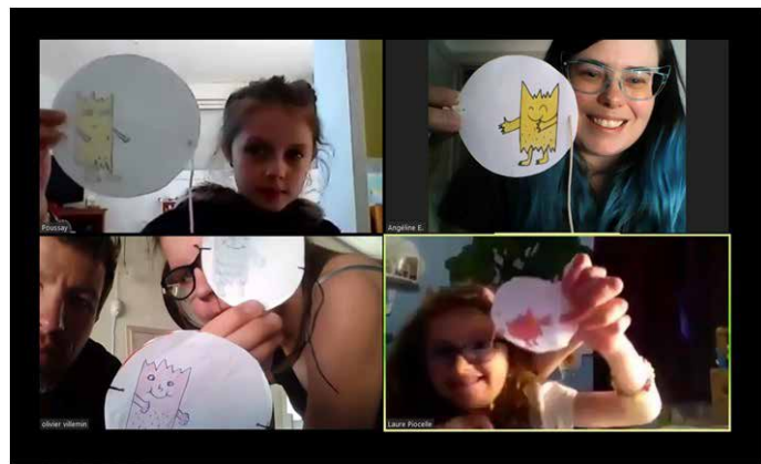
Activité manuelle dans l'écran de la tablette

Autre gros succès de ces mois confinés, la "Mallette numérique" www.mdvosges.mediatheques.fr dont peuvent bénéficier tous les habitants de la Communauté de Communes. Des films, de la musique, des formations, des magazines, autant de ressources "en ligne" à utiliser sans modération. Une offre qui connaît un succès grandissant depuis mars 2020, avec plusieurs dizaines de nouveaux inscrits chaque mois.