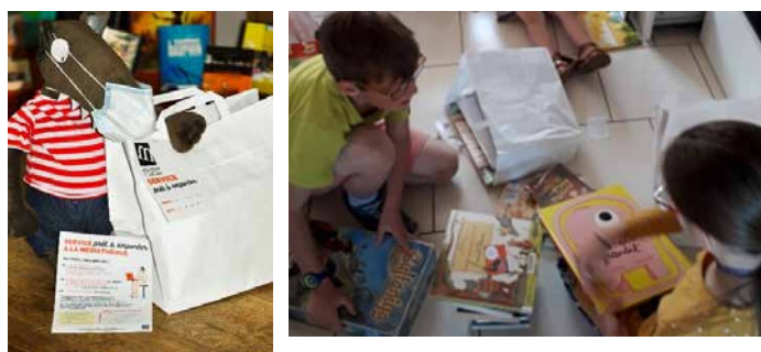
La préparation des sacs...)