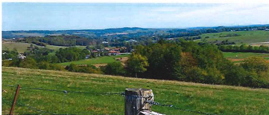
Vallée du Val d'Arol

Le Madon, rivière structurante du territoire a creusé une vallée large dans les marnes du Keuper (entre Maroncourt et Poussay), et plus étroite dans les calcaires à gryphées (au sud de Poussay). Les affluents du Madon sont : - en rive gauche : Saule et Val d'Arol, - en rive droite : Gitte, Xouillon et Coulon.